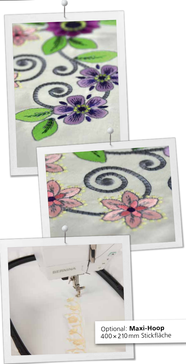
Optional: Maxi-Hoop 400 x 210 mm Stickfläche